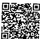
สิ่งที่ส่งมาด้วย ๒

ที่ทำการปกครองอำเภอ สำนักงานอำเภอ โทร/โทรสาร ๐ ๔๕๓๗ ๙๒๕๘