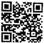
สิ่งที่ส่งมาด้วย ๑